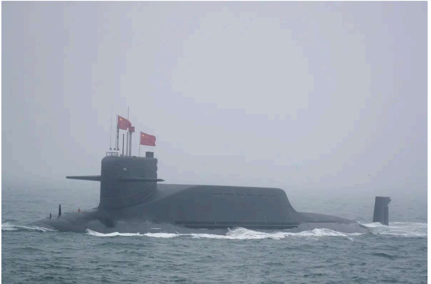
圖為搭載潛射彈道飛彈（SLBM）的共軍潛艦。